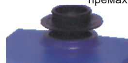
Изкачаща глава PM210